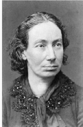
Louise Michel en 1880.

Clémence-Louise Michel , dite Louise Michel , née le 29 mai 1830 à Vroncourt-la-Côte , Haute-Marne et morte le 9 janvier 1905 à Marseille , alias « Enjolras », est une institutrice , militante anarchiste , franc-maçonne , aux idées féministes et l'une des figures majeures de la Commune de Paris . Première à arborer le drapeau noir , elle popularise celui-ci au sein du mouvement libertaire .