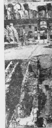
LES FOUILLES CONTINUENT AU COLLÈGE DE BRIVE. On voit dans la cour des débris d'opérations qui remontent à plus de deux siècles.