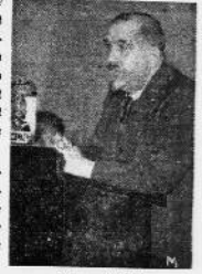
M. Léon JOUHAUX

Au milieu des cris divers et des bordées de sifflets d'une partie de l'assistance, M. Jouhaux s'indigne : « Tout de même, on serait en droit de demander à un Congrès comme le nôtre la politesse. On n'est pas démocrate si on peut croire qu'on a le droit d'imposer aux autres de se taire. »