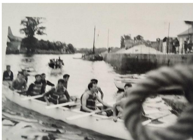
L'arrivée à la cale du Cap Horn